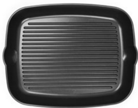
GRILL 24x30 cm