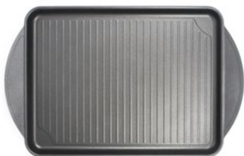
PLATTER 27x36 cm