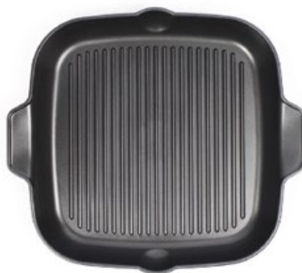
MS 28x28 cm