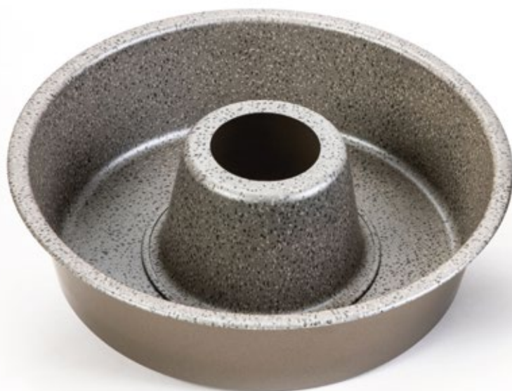
CIAMBELLA DONUT CAKE Ø 28 cm