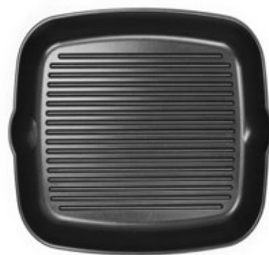
GRILL 28x28 cm