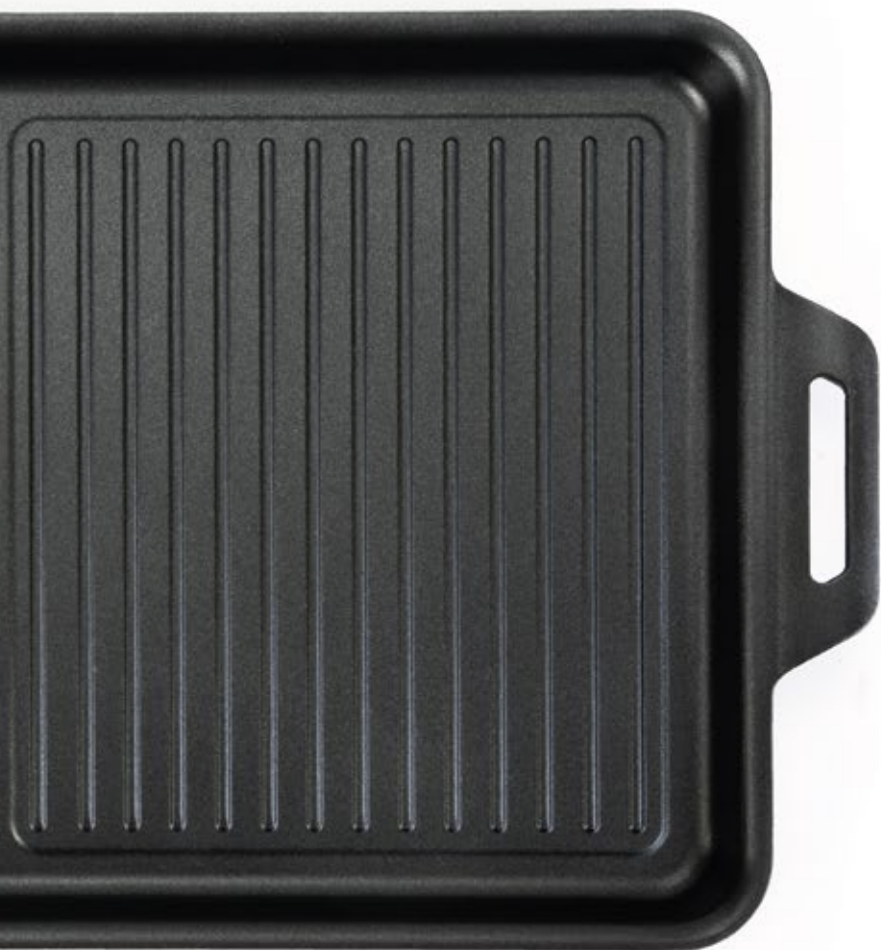
GRILL 50x30 cm