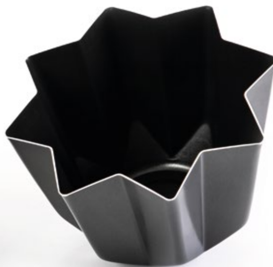
PANDORO 8 FETTE 8 SLICES